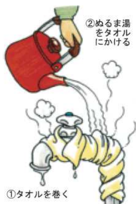
(図は、解氷方法の一例です。)